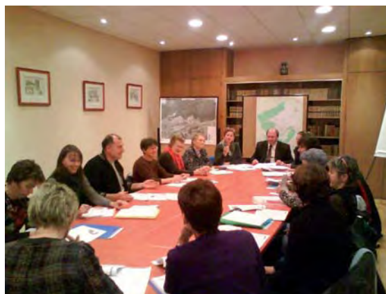
Comité de pilotage

Parallèlement, la Fondation de France, dans le cadre d'un appel à projets intitulé « Vieillir dans son quartier, son village, des aménagements à inventer ensemble », désire encourager les initiatives locales en direction des personnes âgées, favorisant la prise en compte de leur parole et le « mieux vivre ensemble ».