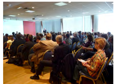
1 ère rencontre des agences d'urbanisme

Cette journée fut également l'occasion de signer une charte afin « d'apporter une réponse originale à la nécessité de mieux coordonner les politiques de développement territorial et urbain ».